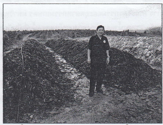
การผลิตปุ๋ยอินทรีย์วิธีใหม่ไม่ต้องพลิกกลับกองจากเศษผักในตลาด วิธีวิศวกรรมแม่ใจ ๑