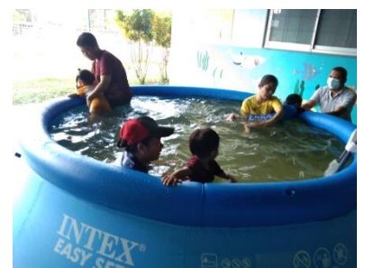
๖ กั๊นยำน